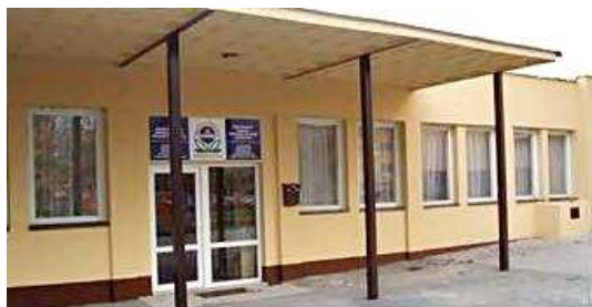
Budova A, Mozartova 2313

e-mail: skolazivota@seznam.cz , http://www.skolazivotafm.wbs.cz