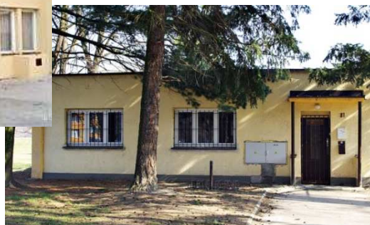
Budova B, 28. října 781