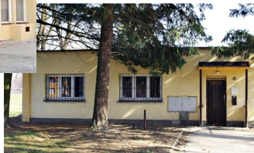
Budova B, 28. října 781