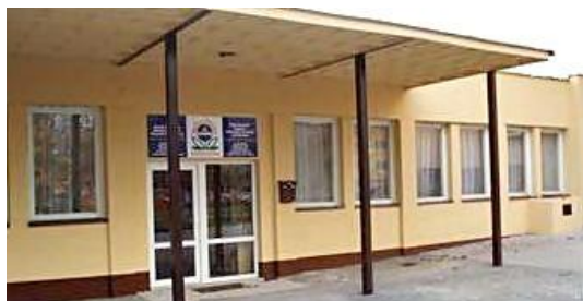
Budova A, Mozartova 2313

e-mail: skolazivota@seznam.cz, http://www.skolazivotafm.wbs.cz